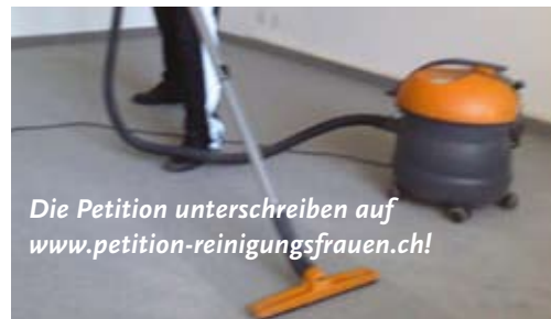
Die Petition unterschreiben auf www.petition-reinigungsfrauen.ch !