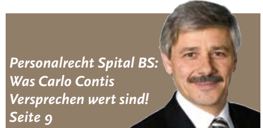
Personalrecht Spital BS: Was Carlo Contis Versprechen wert sind! Seite 9