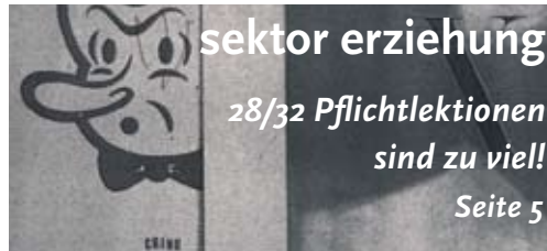
sektor erziehung 28/32 Pflichtlektionen sind zu viel! Seite 5