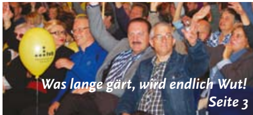
Was lange gärt, wird endlich Wut! Seite 3